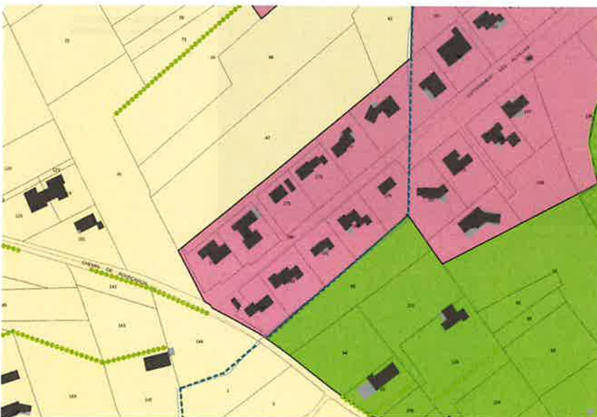
MODIFICATION DU PLU DE PLAN D'ORGON

La procédure de modification est l'occasion de corriger cette anomalie afin d'assurer la cohérence du document d'urbanisme avec les conditions d'urbanisation existantes.